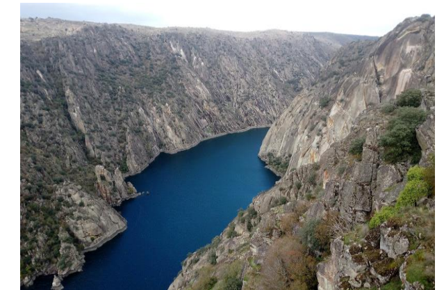
ARRIBES DEL DUERO